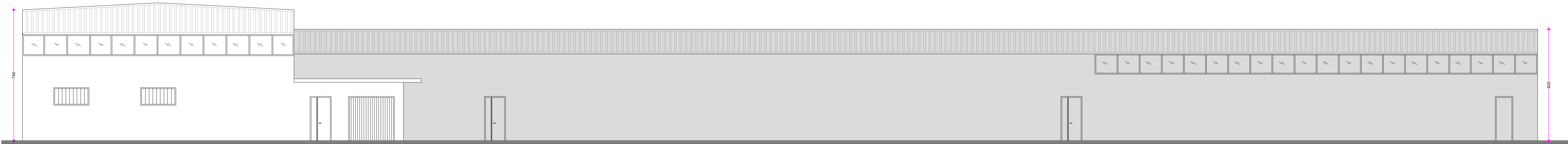
PROSPETTO NORD-EST STATO DI PROGETTO SCALA 1:100